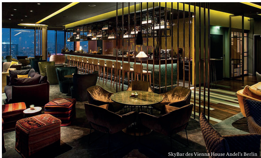
SkyBar des Vienna House Andel's Berlin

Das Programm kann nur komplett gebucht werden.